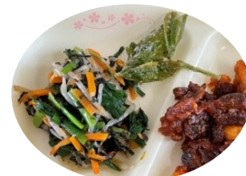
この日の給食は お茶の天ぷらです

摘んだ茶葉は、JA茶ぐりん様で製茶され、松浦製茶様で仕上げ茶ができました。5/11に3年生が牧中特製袋に袋詰めをしました。5/27の午前中に牧之原SA下りで販売予定です。今年はたくさん購入可能です。ぜひ来てくださいね！お待ちしております！！